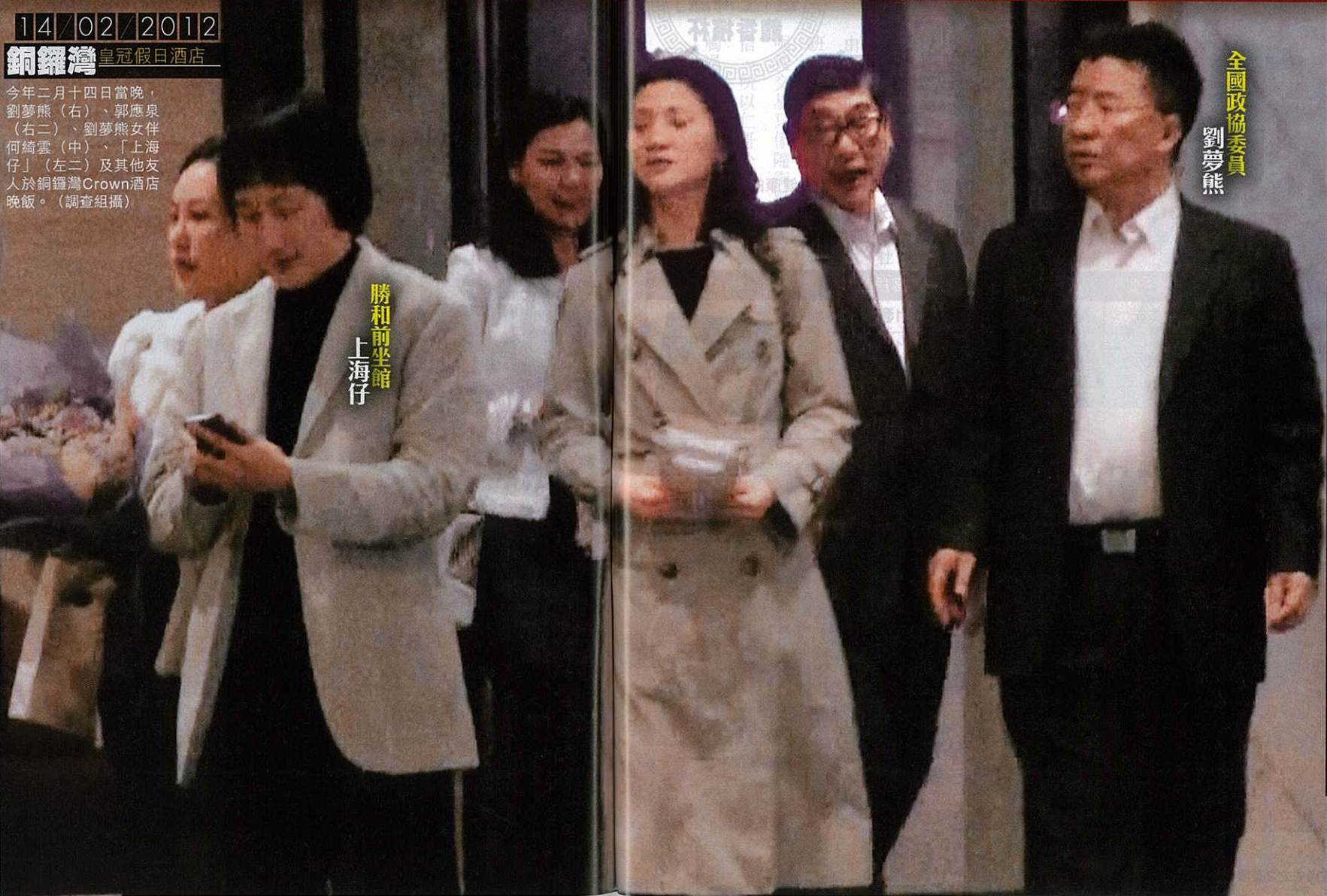
全國政協委員 劉夢熊