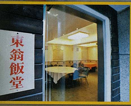
▲梁營成員與鄉事選委在流浮山小桃園酒家舉行飯局，被揭有江湖中人參與。 ▲江湖飯局會面地方「東翁飯堂」只可開兩席。